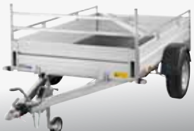
MCALU VIVA - BMH 135V 251x152 cm