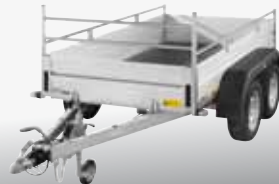
MCALU VIVA - CMG 200V 251x132 cm