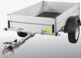
MCALU - BSF 100T 209x112 cm