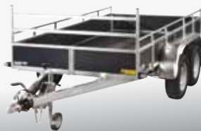
WOODY - CLH 200V 301x152 cm