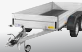
MCALU - CLG 200V 301x132 cm