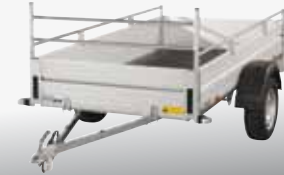
MCALU VIVA - AMG 75V 251x132 cm