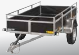
WOODY - ASF 75V 209x112 cm