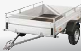
MCALU VIVA - ASG 75V 209x132 cm