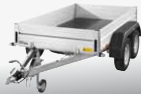
MCALU - CMH 200V 251x152 cm