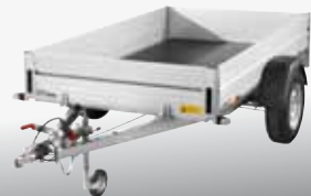
MCALU - BMG 135 V 251x132 cm