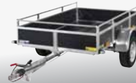
WOODY - BSG 100T 209x132 cm